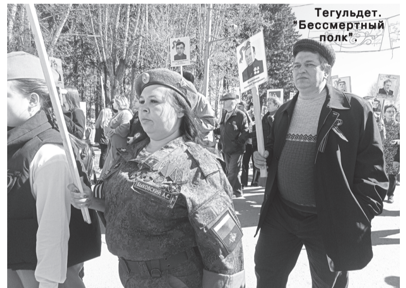
Тегульд. "Бессмертный полк"

В этом посёлке, как и повсюду, царил торжественный обстановка. Перед праздником улицы украсили флагами, разрисовали окна домов праздничной символикой, у домов и на территориях навели порядок. На состоявшемся митинге с приветственными словами выступили глава с/по-