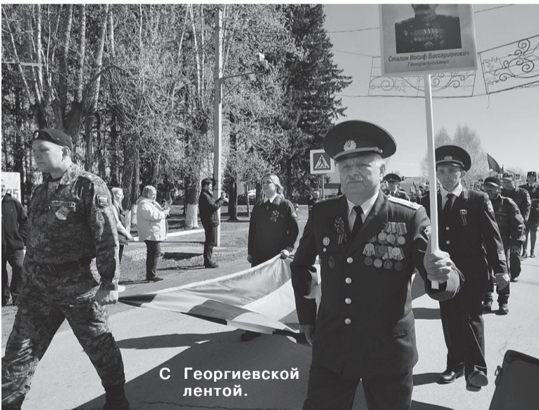
С Георгиевской лентой.

минутой молчания всех павших на полях сражений, заставивших замереть сердца. В этой тишине каждый вспоминал своих родных и близких, отдавших жизни в борьбе с фашизмом. Учащиеся школы и жители возложили цветы к памятнику. Пока мы будем помнить об этой войне, мы будем жить, будут жить наша Родина, Россия.