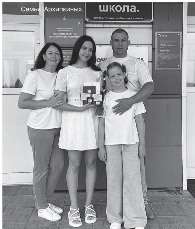
абитуриентка Томского медицинского университета.