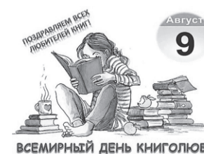
ВСЕМИРНЫЙ ДЕНЬ КНИГОЛЮБА

14.35 Д/ф "Дэвид Бекхэм. Одиозный". 12+ 16.05, 09.30 Матч! Парад. 16+ 17.55 Регби. Pari Чемпио- нат России. "Слава" (Моск- ва)-"ВВА-Подмосковье" (Монино). Прямая транс- ляция. 21.00 Футбол. МИР Рос- сийская Премьер-Лига. "Локомотив" (Москва)- "Спартак" (Москва). Прямая трансляция. 00.15 Футбол. МИР Рос- сийская Премьер-Лига. "Ах- мат" (Грозный)-"Зенит" (Санкт-Петербург). Прямая трансляция. 04.00 Смешанные единобор- ства. UFC. Роман Долидзе против Энтони Эрнандеса. Прямая трансляция из США.