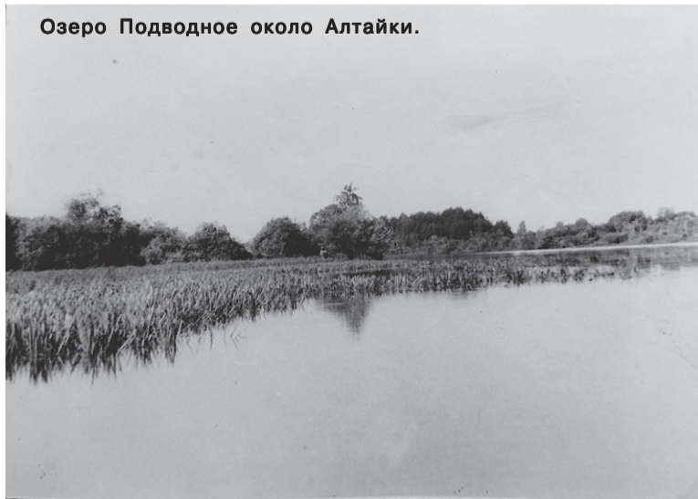
Озеро Подводное около Алтайки.