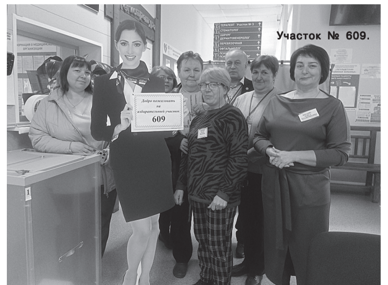
Участок № 609.

В Томской области приняли участие в выборах более 158 тысяч избирателей, включенных в списки (21%).