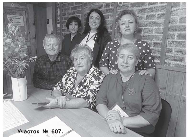
Участок № 607.

66-летний житель Берегаево поделился: «Я сам не хожу на местные выборы, считаю это напрасной тратой времени, так как того выберут, реально ничего не