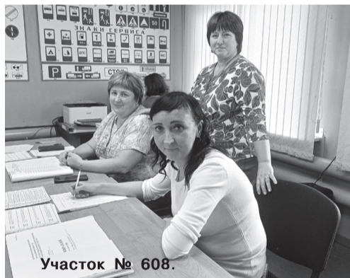
Участок № 608.