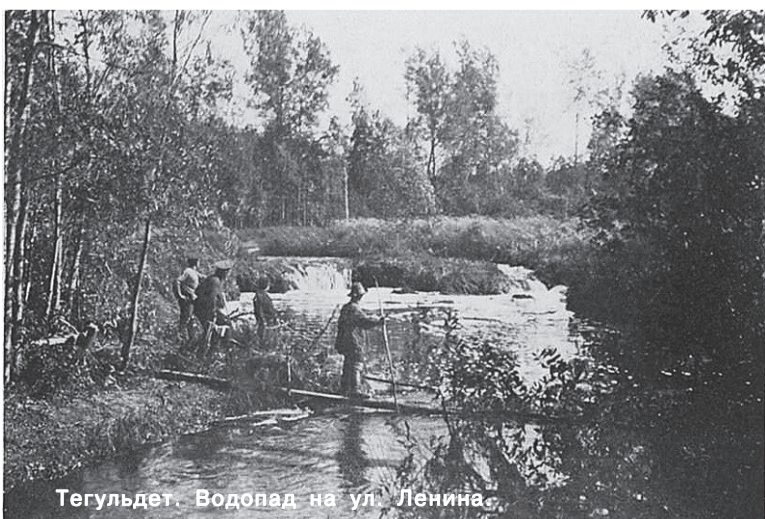
Тегульдет. Водопад на ул. Ленина.

Река Чулым, правый приток Оби, в переводе с тюрского означает «бегущий снег». В своём среднем течении река делит его на лево- и правобережную часть. К примеру, есть реки: Берёзовая (приток Малой Еловой), Верхняя Олёнка, Грядовый (ручей), Коль (приток Малой Еловой), Кыцы, Листвянка (приток Малой Еловой), Малая Берёзовая (приток Малой Еловой), Малая Еловая (приток Малой Еловой), Питейка, Тагылдат, Тонгул, Туйдат, Чёрная (приток Улулула).