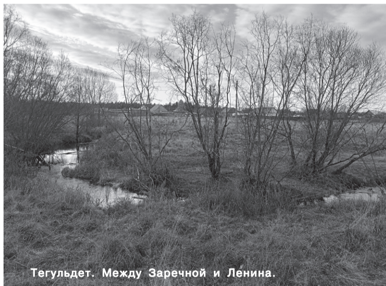
Тегульдет. Между Заречной и Ленина.

Тегульдет был основан в 1911 г. переселенцами из Вятской губернии. Через 25 лет он стал районным центром. По левую сторону поселение называлось Язовкой, которая стала улицей Партизанской, а по правой - Тегульдет (улица