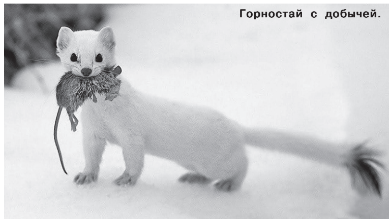
Горностаю с добычей.

Ещё 1 августа была открыта охота на волков, которая продлится до 28 февраля 2026 года. Рост популяции этого хищника - серьёзная проблема в Томской области.