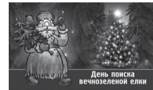
День поиска вечнозеленой ели

18.20 Непридуманные истории. Псковская область. 12+ 18.55 Магия большого спорта. Шахматы. 12+ 20.25 Д/ф "Владимир Сальников. Не надо спорить с тренером...". 12+ 21.30 Плавание. Международные соревнования "Кубок Владимира Сальникова". Прямая трансляция из Санкт-Петербурга. 01.45 Футбол. Суперкубок Италии. 1/2 финала. "Болонья"-"Интер". Прямая трансляция из Саудовской Аравии. 05.00 Смешанные единоборства. One FC. Трансляция из Таиланда. 16+ 06.55 Скелетон. Кубок мира. Мужчины. Трансляция из Латвии. 6+ 07.55 Новости. 0+ 08.00 Баскетбол. Единая лига ВТБ. "Зенит" (Санкт-Петербург)-"Локомотив-Кубань" (Краснодар). 6+