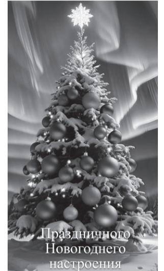
Праздничного Новогоднего настроения

матч". 0+ 12.00 Х/ф "Команда мечты". 6+ 13.30, 15.55, 18.15, 20.25, 23.40 Титаны. Сезон. 16+ 02.35 Д/ф "Год российского спорта". 12+ 03.35 Вы это видели. 12+ 08.10, 08.40, 09.10, 09.35 География спорта. 12+