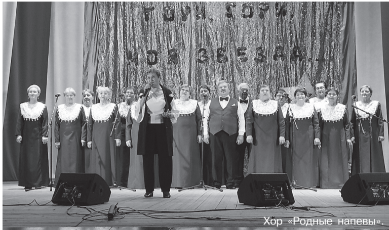
Хор «Родные напевы».

«Гори, гори, моя звезда» в январе прошёл праздничный концерт, посвящённый 10-летию хора «Родные напевы», состоявшийся в Тегульдетском РЦТиД.