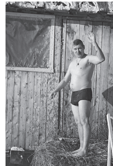
А еще на Крещение нельзя было выполнять тяжелую работу и заниматься домашними делами. Что наше население и делало.