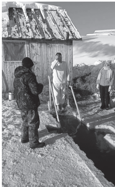
19 января в Тегульдетском районе прошли крещенские купания. Десятки

жителей, не испугавшись 45-градусного мороза, окунались в иордань на реке Чулым, организованной в Берегаево. В Тегульдете из-за аномальной погоды купель на буровой не устанавливалась.