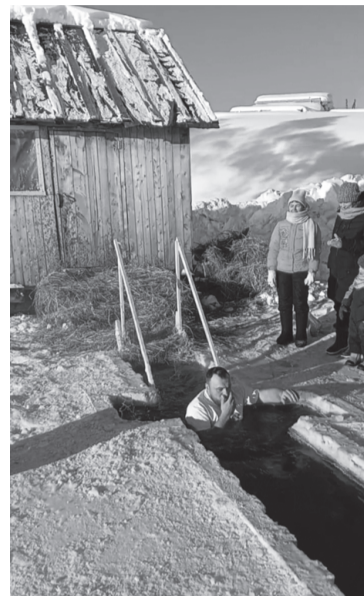
да стоят суровые морозы и для восстановления энергии требуется калорийная еда.

После церковной службы люди собирались семьями за праздничным столом, где главным блюдом была кутья - каша из пшеницы или риса с мёдом и маком. А перед этим они с достоинством соблюдали строгий пост, воздерживаясь от мясной пищи. Но, как правило, это не у нас, в Сибири, ког-