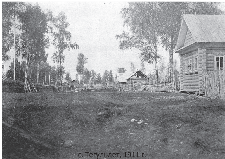
с. Тегульдет, 1911 г.

С 1 марта заведения общепита и магазины начнут штрафовать за вывески на иностранном языке. Как поясняют эксперты, отдельного штрафа за «иностранную вывеску» в Кодексе РФ об административных правонарушениях пока нет, поэтому вывеска, не соответствующая требованиям, может быть расценена, как несоблюдение права потребителя на получение необходимой и достоверной информации. Запрет не распространяется на фирменные наименования и товарные знаки.