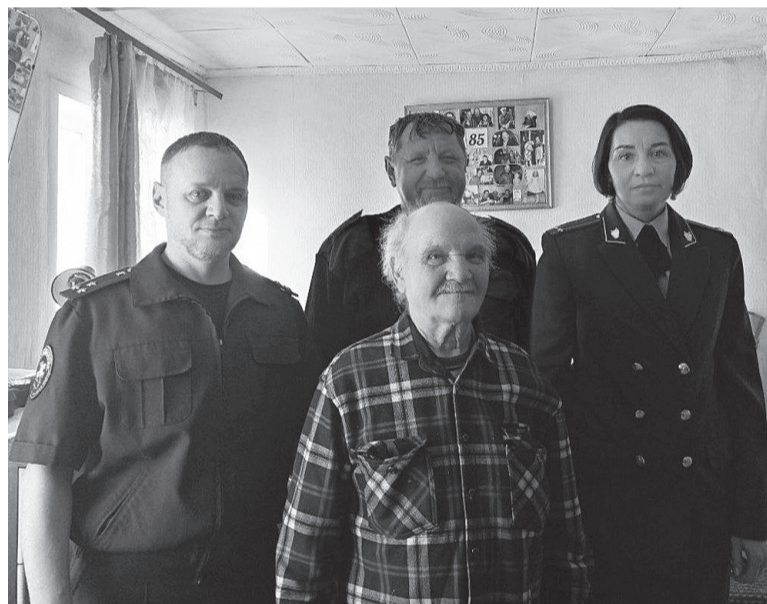
в совхозе «Тегульдетский». За многолетний добросовестный труд он неоднократно отмечался