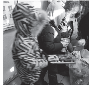
в «Коробках храбрости» никогда не заканчиваются.