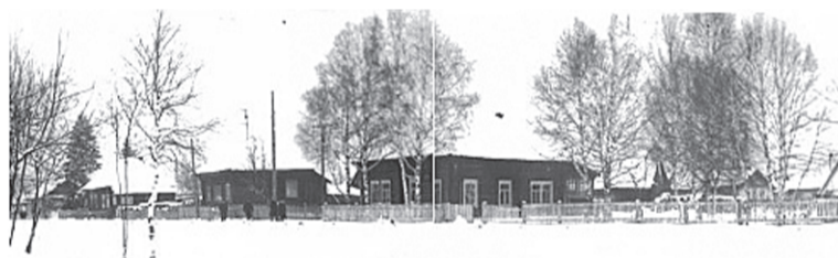
Ул. Ленина: было (вверху) и стало (внизу)

В 2004 году сдали в эксплуатацию новое трёхэтажное здание, где работают сотрудники администрации Тегульдетского района, Ростелекома, Почты России, соцзащиты, органов опеки и попечительства, нотариус, ЗАГС, МФЦ, «Единая Россия», Единая диспетчерская служба, избирательная комиссия и другие.