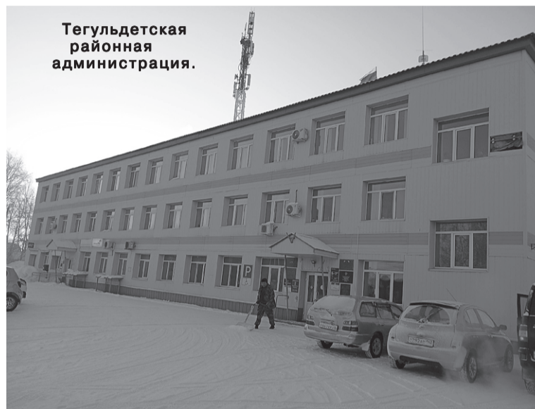
Тегульдетская районная администрация.

За тридцать последних лет районный центр разросся вдвое. В последние годы идёт интенсивное строительство жилья. Появились новые улицы: Юбилейная, Молодёжная, Сибирская. Новые частные дома ук-