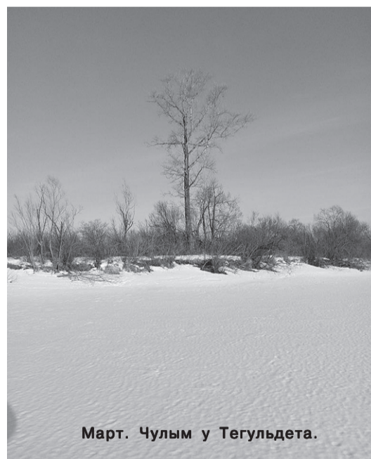
Март. Чулым у Тегульдета.

В соответствии с прогнозом органам власти предстоит вести контроль гидрометеорологических параметров и уточнение текущей обстановки, складывающейся на территории населённых пунктов. Исхо-